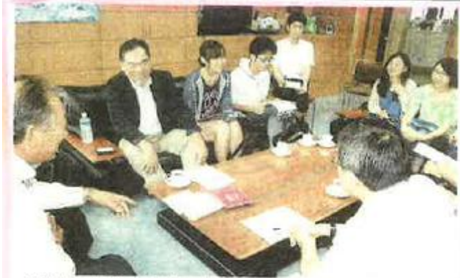
岸町長(左)と懇談する奥山教授(左から2人目)や学生