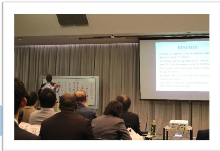
2. グローバル E-キャン発表風景

今回の「活動報告会」では、上記の3つのプロジェクトと、「グローバル E-キャン」のメンバーがそれぞれ発表を行いました。